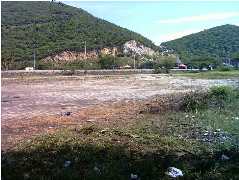
Lote donde se construirá la EBAR.