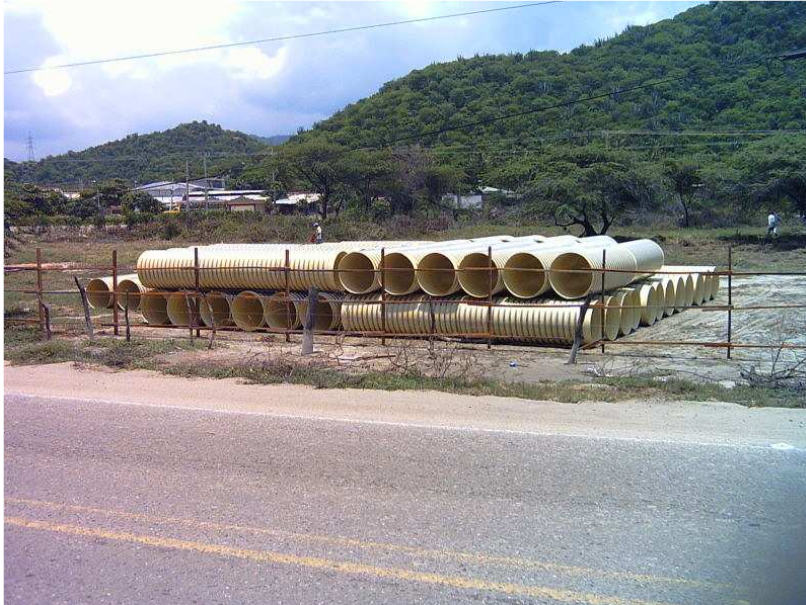
Primera entrega de tubería de 40" almacenada en el lote EBAR